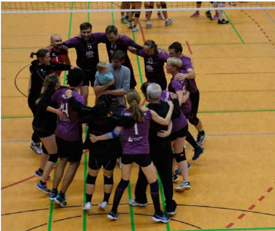
Jubel beim SC Baden-Baden über Platz 3

SC Baden-Baden aber noch einmal konzentrieren und den Weidener SF aus Köln auf den vierten Platz verweisen und sich einen Platz auf dem Treppchen sichern.