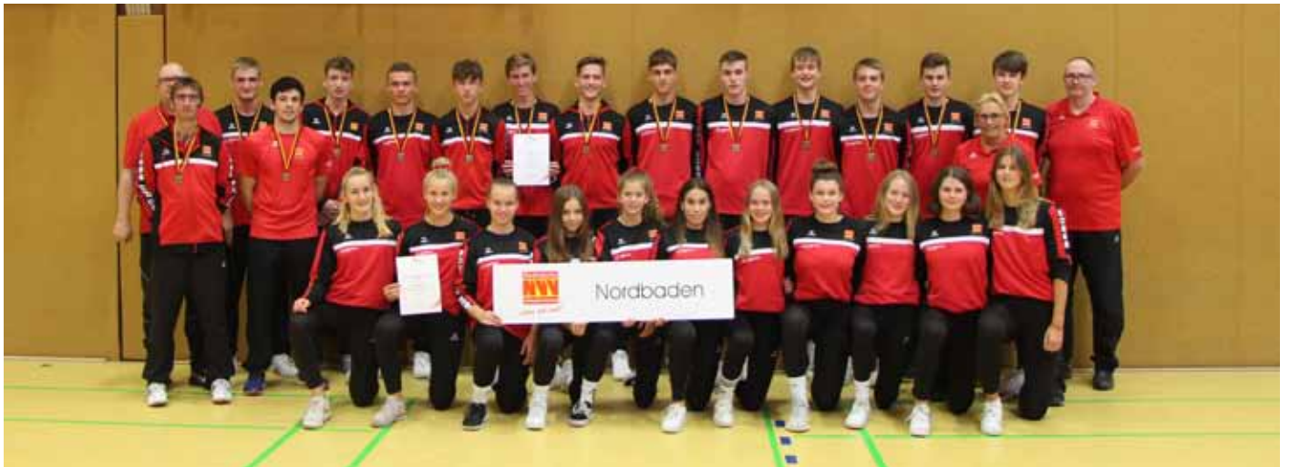
Beim Bundespokal Süd in Dippoldiswalde/Sachsen belegten die NVV-Jungs einen ausgezeichneten 3. Platz und die NVV-Mädchen einen 6. Platz.